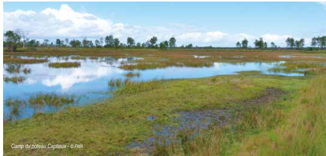
Camp du poteau Captieux

● Sortie Nature à la découverte des marais de Sanguinet. Organisée par la Communauté de communes des Grands Lacs en partenariat avec la Fédération des chasseurs des Landes et la Fédération pour la pêche et la protection des milieux aquatiques des Landes. Venez découvrir les zones humides attenantes au lac de Cazaux-Sanguinet. Entretenues par l'association des Chasseurs Gestionnaires de l'Environnement Lacustre du Born, la Fédération des Chasseurs et la Fédération de pêche, vous apprendrez ses intérêts pour l'avifaune et les poissons ! Tarif : Gratuit. Type de public : Tout Public. Réservation obligatoire : oui avant le 16 février 2018. Contact : 05 58 78 54 63 - natura2000@cdc-grands-lacs.fr . RDV : à 9h. Durée : 4h.