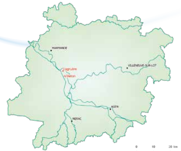
Sources : ADMIN EXPRESS 2017, GEOFLA 2015 : IGN Auteur : Forum des Marais Atlantiques