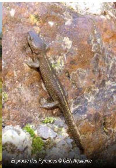
Euproctes des Pyrénées

Depuis 1990, le Conservatoire d'espaces naturels (CEN) d'Aquitaine contribue à préserver la biodiversité par la mise en œuvre d'une gestion écologique ancrée localement. La connaissance, la préservation, la gestion, et la valorisation du patrimoine naturel et paysager d'Aquitaine constituent ses missions.