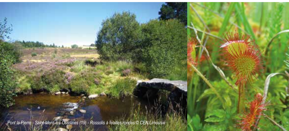
Pont la Pierre - Saint-Merd-les-Oussines (19) - Rossolis à feuilles rondes

humides jouent notamment un rôle de filtre physique en retenant les matières en suspension transportées par les eaux de ruissellement. Ce rôle est essentiel pour préserver la qualité des cours d'eau à Truites.