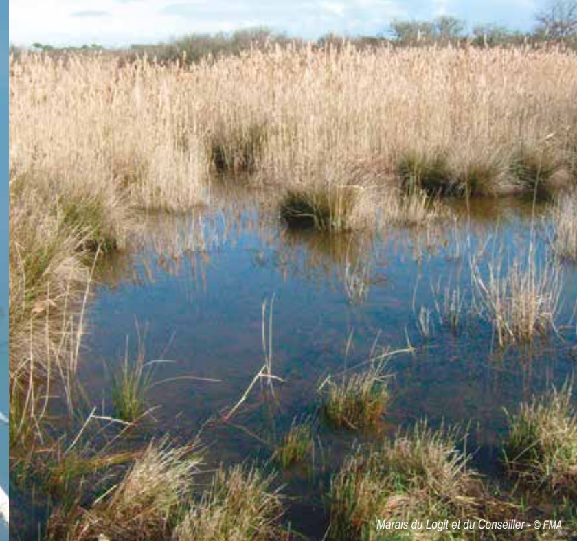
Marais du Logit et du Conseiller