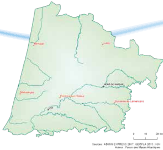
Sources : ADMIN EXPRESS 2017, GEOFLA 2015 : IGN Auteur : Forum des Marais Atlantiques