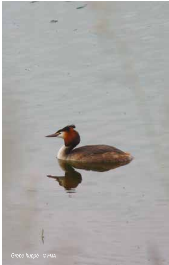
Grebe huppé