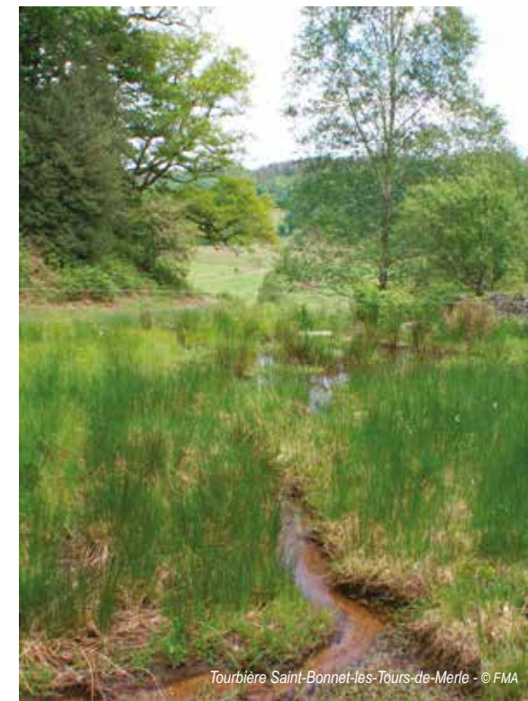
Tourbière Saint-Bonnet-les-Tours-de-Merle

Chantier bénévole nettoyage léger d'un cours d'eau sur la commune de Viam. Organisée par le Conservatoire d'espaces naturels du Limousin. Chantier bénévole sur la tourbière du Tronchet. Au programme nettoyage léger d'un cours d'eau combiné à des petits travaux de bûcheronnage débroussaillage. Prévoir une tenue imperméable (bottes ou cuissardes, gants imperméables, scies, bûches...) ainsi qu'un pique-nique pour le midi. Tarif : Gratuit. Type de public : Tout Public. Réservation obligatoire : oui avant le 23 février 2018. Contact : 05 55 03 29 07 tjouillat@conservatoirelimousin.com . RDV : 9h30 parking de l'église de Viam à 9h45. Durée : de 9h45 à 16h.