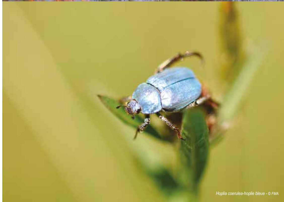
Hoplia coerulea-hoplie bleue