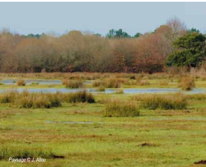
Paysage © J. Allou