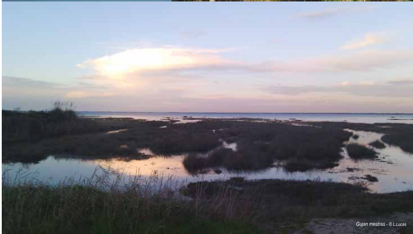
Gujan mestras