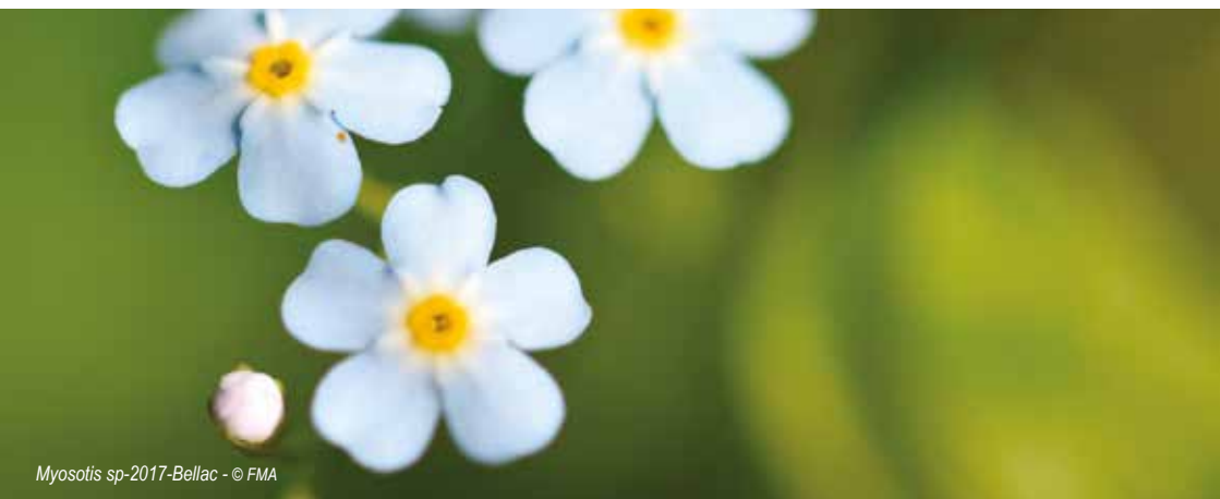
Myosotis sp-2017-Bellac